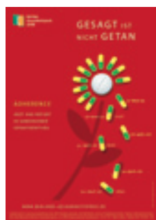
2008 Adherence – Arzt und Patient in gemeinsamer Verantwortung