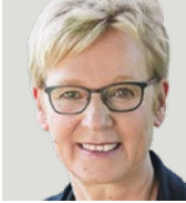
BÜNDNIS 90/ DIE GRÜNEN

Name: Klein-Schmeink, Maria MdB Geburtsdatum: 06.01.1958 Beruf: Soziologin MdB seit: 2009 Spezialgebiet, besondere Interessen: Grundsatzfragen, Patientenrechte, psychische Gesundheit