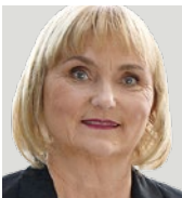
BÜNDNIS 90/ DIE GRÜNEN