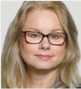
BÜNDNIS 90/ DIE GRÜNEN

Name: Kappert-Gonther, Dr. Kirsten MdB Geburtsdatum: 03.11.1966 Beruf: Fachärztin für Psychiatrie und Psychotherapie MdB seit: 2017 Spezialgebiet, besondere Interessen: Sprecherin für Gesundheitsförderung, Sprecherin für Drogenpolitik Weitere Themen: ambulante und stationäre Versorgungs- strukturen, Prävention, Drogenpolitik, Familien- und Kinder- gesundheit, Frauen im Gesundheitswesen, Medizinethik, Transplantationsmedizin, europäische Gesundheitspolitik